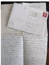
Brief