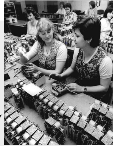
VEB Elektronik Gera 1984.

Diese Studie fragt, welches Wissen über die Stasi DDR-Bürger durch ihre sozialen Beziehungen am Arbeitsplatz, und innerhalb ihrer Familie und im Freundeskreise erworben haben. Sie konzentriert sich auf Volkseigene Betriebe (VEB) im ehemaligen Bezirk Gera. Ich führte Gespräche mit ehemaligen DDR-Bürgern, die in unterschiedlichen Positionen (Arbeiter und Angestellte) in verschiedenen VEBs arbeiteten. Ich habe Akten über spezielle VEBs im Stasi-Unterlagen-Archiv eingesehen, und wenn Gesprächspartner persönliche Akten hatten und ihre Einwilligung gaben, habe ich diese auch eingesehen.