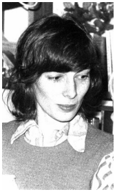
Bettina Wegner (1974)

Bettina Wegner ist eine Liedermacherin und Dichterin, die in der DDR lebte. Von 1972 bis 1980 war sie mit dem Schriftsteller Klaus Schlesinger verheiratet. Als prominente, staats- und parteikritische Persönlichkeiten waren Wegner und Schlesinger der 'offenen Überwachung' durch die Stasi ausgesetzt; eine gängige Taktik, die eingesetzt wurde, um Angst zu erzeugen. Wegner erinnert sich an Autos, die vor ihrem Haus vorfuhren und an Verfolgungen, die so offensichtlich waren, dass sie zweifellos bemerkt werden sollten. Auf die Überwachung durch die Stasi reagierten Wegner und Schlesinger oft mit eigenen Strategien. Nachdem die Stasi ihre Wohnung ohne gültigen Durchsuchungsbefehl durchstöbert und einige von Wegners Büchern und Liedtexten beschlagnahmt hatte, entschloss sich Schlesinger, rechtliche Schritte einzuleiten. Ein anderes Mal, als zwei Stasi-Offiziere einen Auftritt Wegners in einem Jugendclub besuchten, ließ sie zwei Gläser Sekt an den Tisch schicken, an dem die Stasi-Offiziere saßen, woraufhin die beiden Männer den Club verließen.