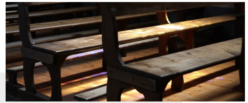
Kirchenbänke, Creative Commons.

In dieser Studie geht es um die evangelische Kirche in der DDR, besonders die ehemalige Kirchenprovinz Sachsen.