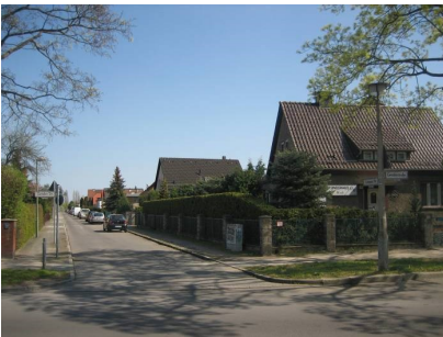
Eine der betroffenen Strassen.

In der DDR gab es ein System von Eingaben. Bürger:innen durften schriftliche Klagen, Anforderungen oder Vorschläge an öffentliche Einrichtungen schicken und erhielten